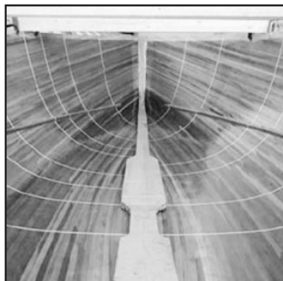
Il dettaglio del fasciame del nuovo scafo